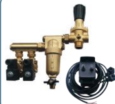
KIT COMANDO ELÉCTRICO