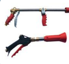
LANZA Y PISTOLA