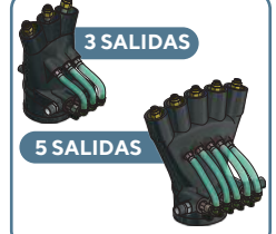
TOBERAS DE POLIETILENO

CHASKI SE RESERVA EL DERECHO A HACER CAMBIOS O MODIFICACIONES A LOS EQUIPOS SIN PREVIO AVISO - FOTOS REFERENCIALES