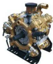
BOMBA IDS 1501 (BRONCE)