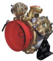
BOMBA BHS 150 (BRONCE)