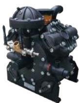
BOMBA APS 145